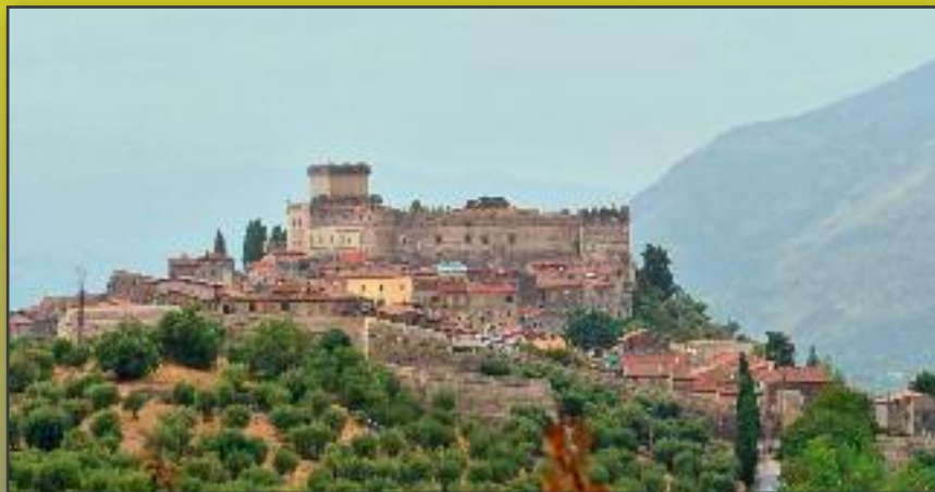
IL CASTELLO CAETANI DI SERMONETA