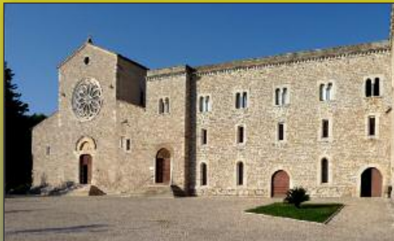
L'ABBAZIA DI VALVISCIOLO

L'Abbazia di Valvisciolo è situata nel territorio di Sermoneta ai piedi del Monte Corvino, a meno di 100 metri sul livello del mare; i monti la proteggono dai venti del nord; dall'ampio piazzale lo sguardo si spinge verso la pianura pontina fino al mare. E' dedicata al protomartire Santo Stefano. La Storia di questo monastero è complessa. Anche il nome nasconde una parte di mistero. Valvisciolo può significare Valle dell'Usignolo (vallis luscinae) o Valle delle Visciole (una varietà di ciliegie selvatiche). E' assodato che in origine il nome individuasse un altro monastero cistercense in territorio di Carpineto Romano, del quale oggi rimangono scarsi ruderi. All'inizio del secolo XIV i monaci di Carpineto abbandonarono i loro monti e si trasferirono nel nuovo monastero al quale attribuirono l'avito nome di Valvisciolo.